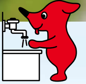
千葉県 PR マスコットキャラクター チーバくん