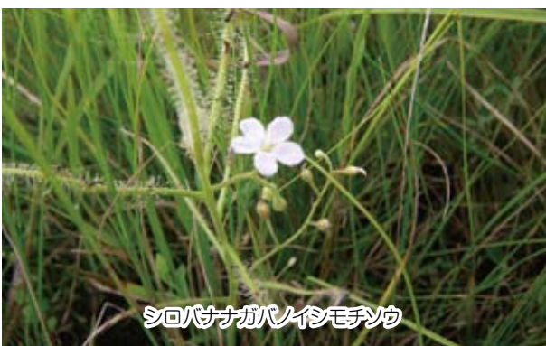
シロバナガバインモチソウ

私たちは先人たちの熱い想いを引き継ぎ、これから百年先の子孫にも継承していきたいと思っています。