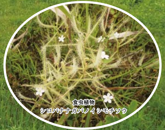
食虫植物 シロバナナガバノイシモチソウ