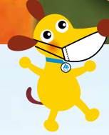
法人会キャラクター ケンタくん