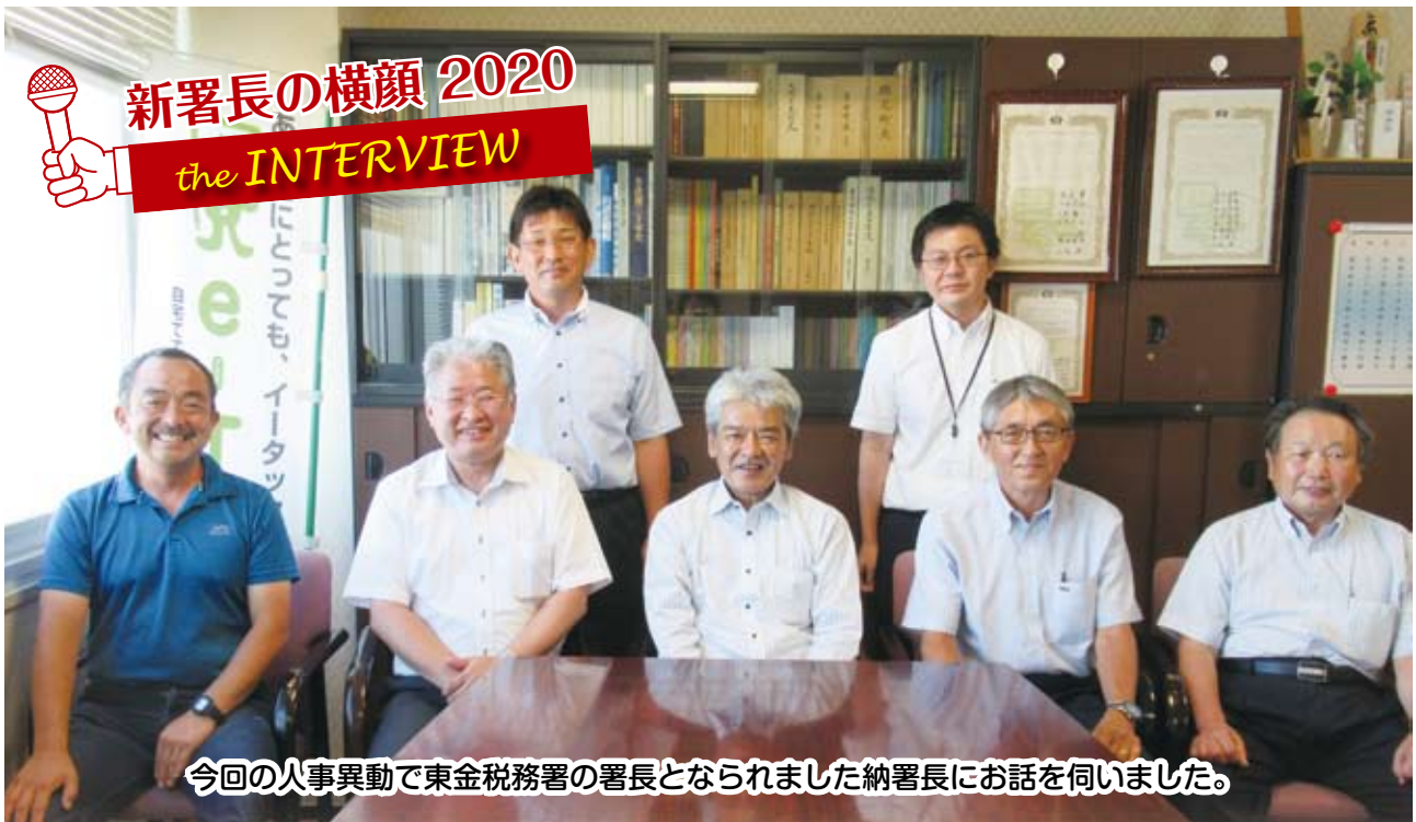
今回の人事異動で東金税務署の署長とられました納署長にお話を伺いました。

▶いきなりですが、署長のお名前は、お仕事にぴったりですね。ご出身の奄美大島には多い名字なのですか。