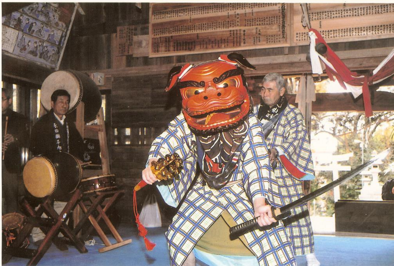
永田の獅子舞（大網白里町）