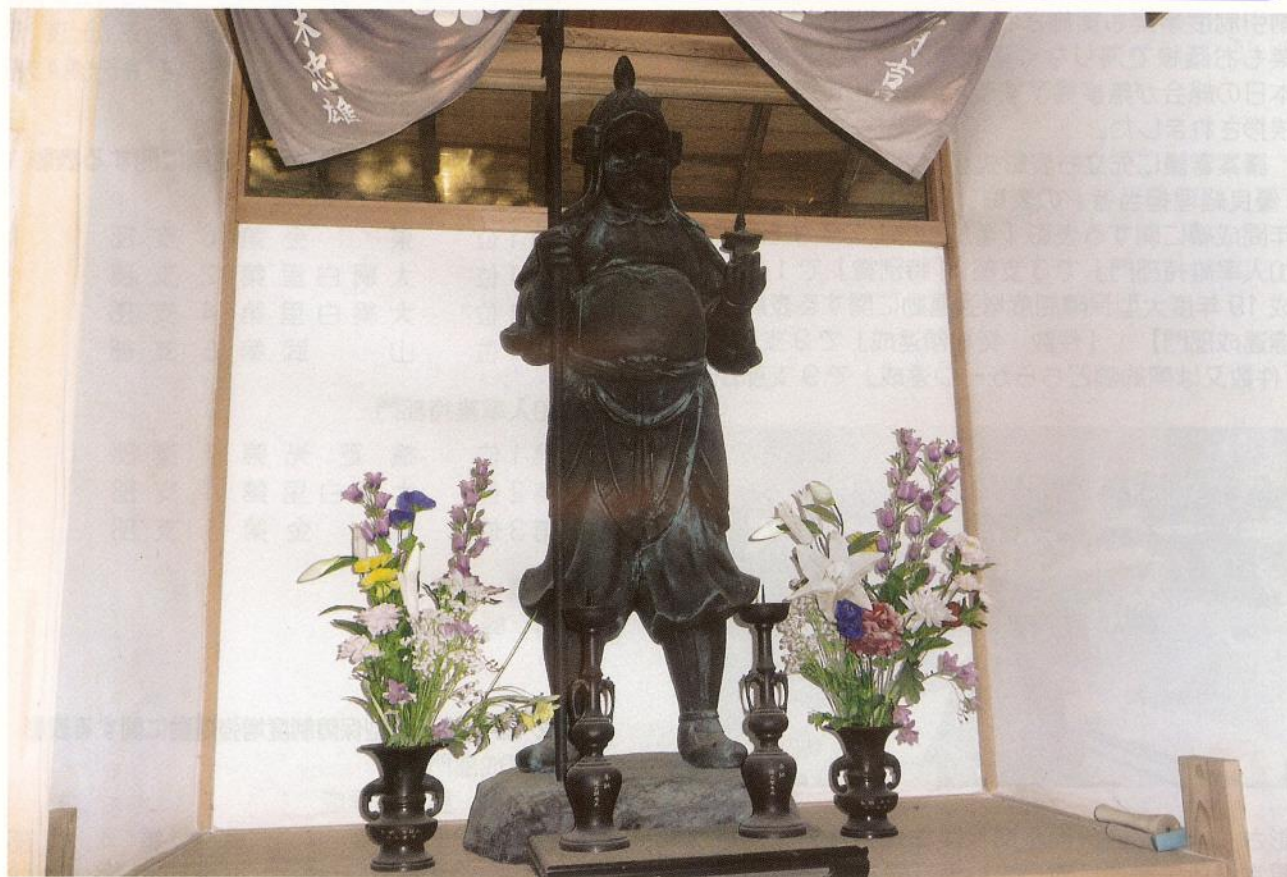
新泉観音堂の毘沙門天（山武市）

□ URL http://www.togane-hojinkai.or.jp □ E-mail togane-h@amber.plala.or.jp