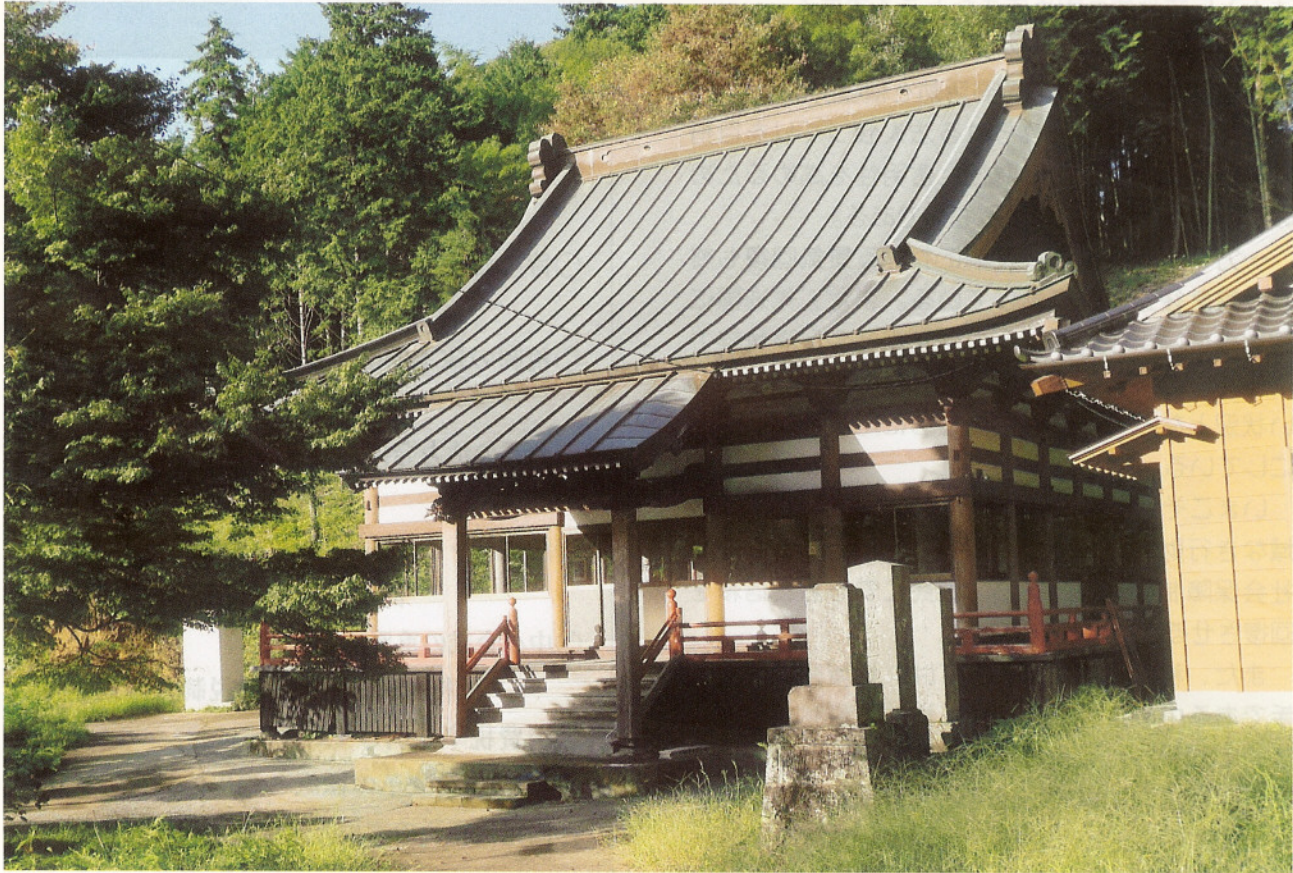
日蓮宗 正覚山木円寺（旧山武町）