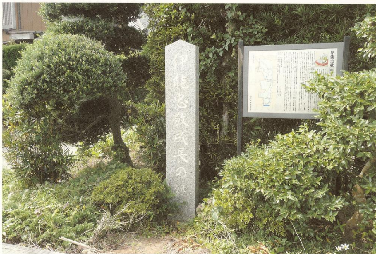
伊能忠敬ゆかりの地（旧横芝町）