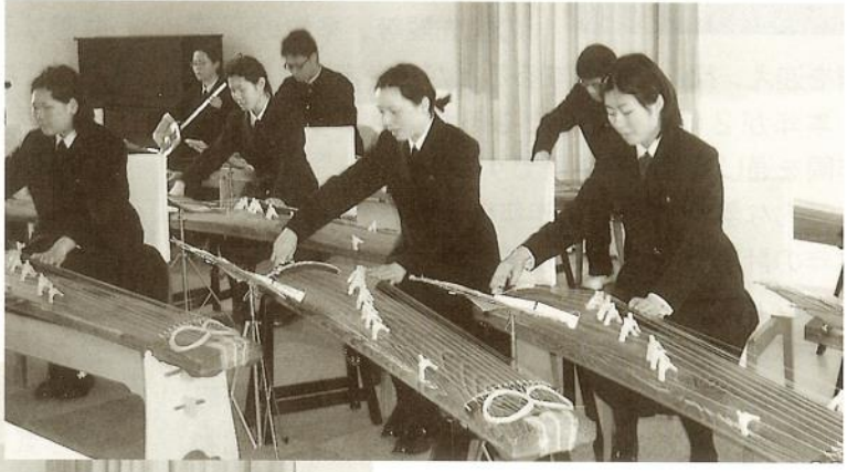
県立東金高等学校箏曲部の皆さん