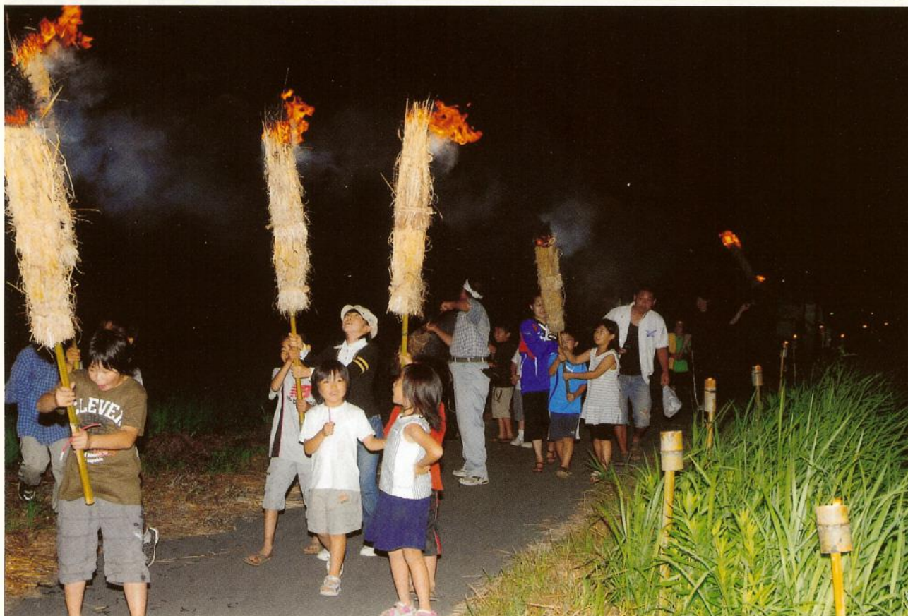
虫送り（九十九里町）

□ URL http://www.togane-hojinkai.or.jp □ E-mail togane-h@amber.plala.or.jp