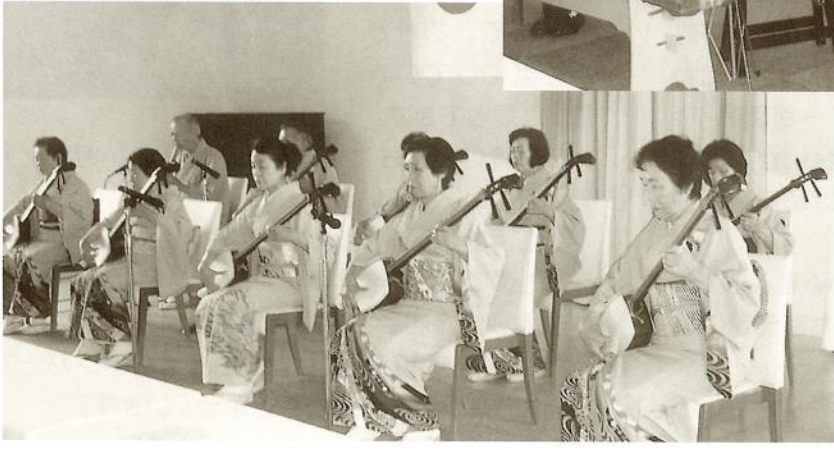
藤本隆秀光世会 社中