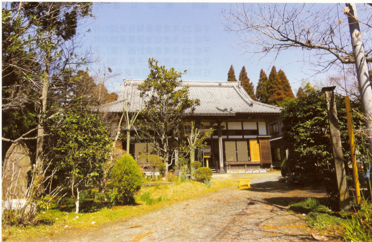
日蓮宗 高勝山長徳寺（旧山武町）