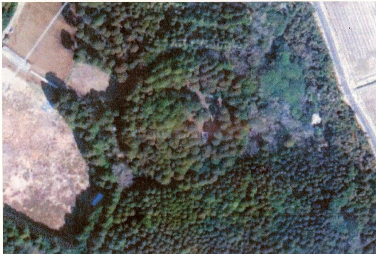
山室姫塚古墳（旧松尾町）