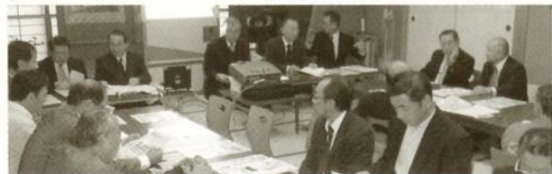
11/22 横芝光・芝山ブロック