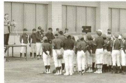
11/27 山武、横芝光・芝山ブロック 少年野球教室