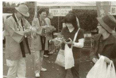
11/22 横芝光第1～4支部 横芝光町産業祭に参加