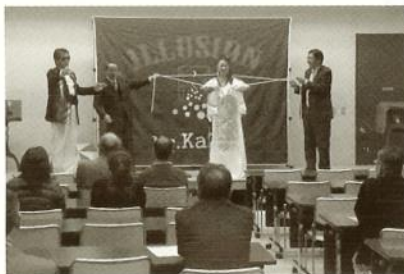
11/18 東金ブロック アトラクション