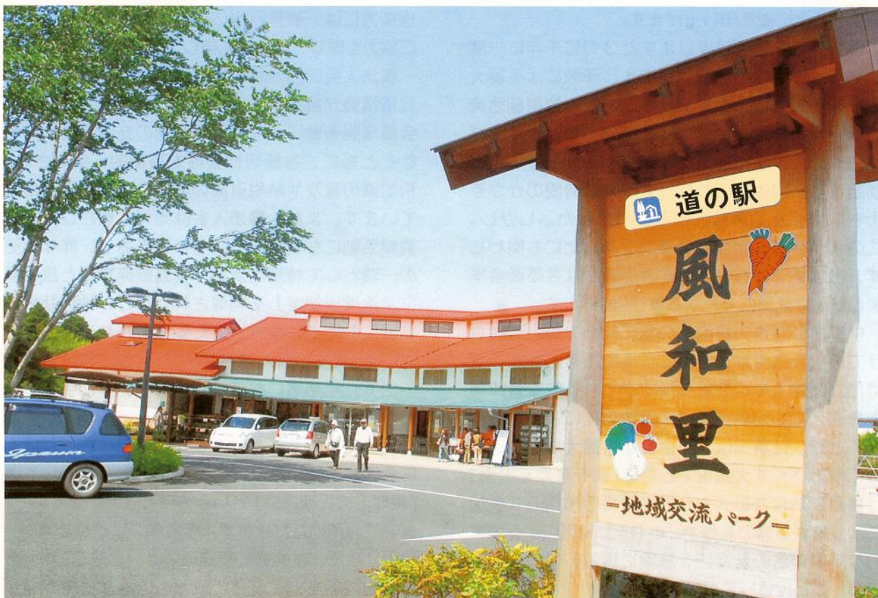
風和里しばやま（芝山町）

□ URL http://www.togane-hojinkai.or.jp □ E-mail togane-h@amber.plala.or.jp