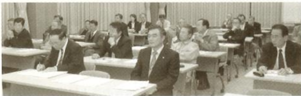
11/11 大網白里・九十九里ブロック

11月11日から17日までの「税を考える週間」にちなんで、4会場に分かれて開催されました。東金税務署からは草野署長、小嶋統括官、相葉上席調査官が、出席され座談会が行われました。