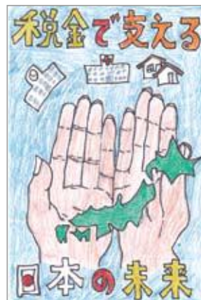
銀賞 山武市立緑海小 並木 裕雅