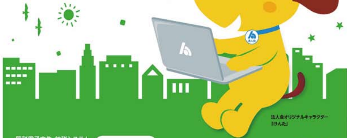
法人会オリジナルキャラクター 「けんた」

「e-Tax」なら国税に関する申告や納税、申請・届出などの手続きがインターネットで行えます。