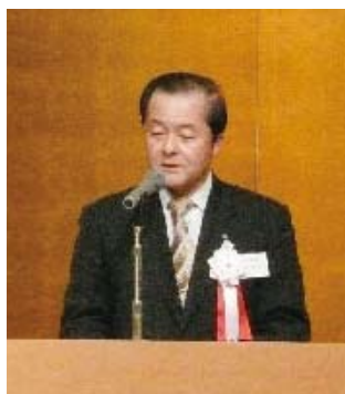
千葉県法人会連合会会長

平成 26 年 1 月 24 日（金）に県法連主催の新年賀詞交歓会が、三井ガーデンホテル千葉で開催され第 1 部において、「今後の日本経済の行方について」と題して経済評論家・中小企業診断士でもある三橋貴明氏による講演会が行われました。