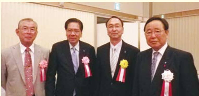
〈左から〉 真行寺副会長 古城副会長 矢部副会長 中嶋会長