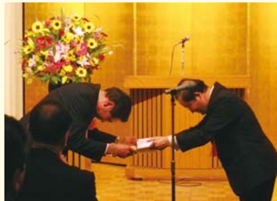
受賞する古城副会長