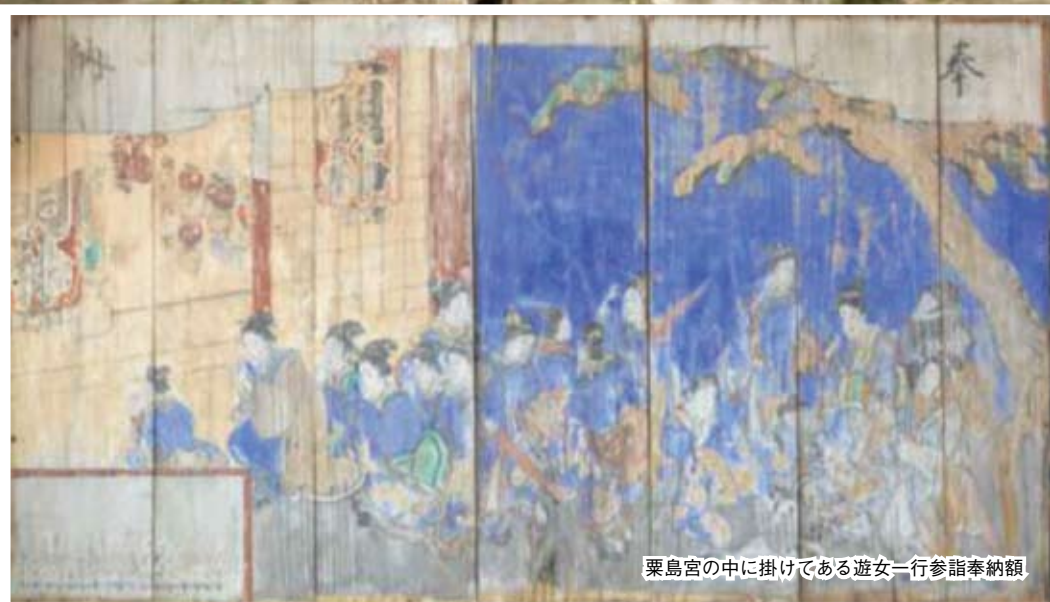
栗島宮の中に掛けである遊女一行参詣奉納額