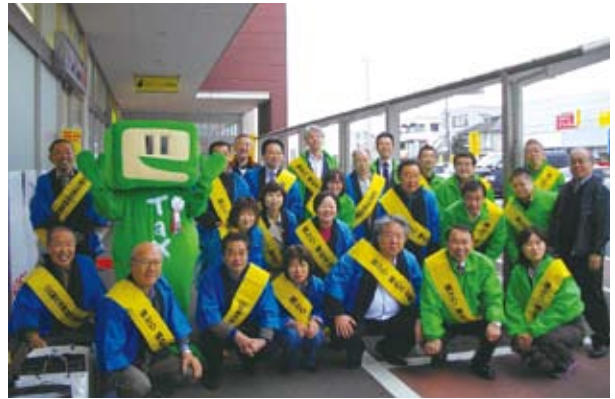
街頭キャンペーン (バイシア大綱)