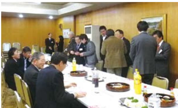
昨年の新入会員のつどいの様子