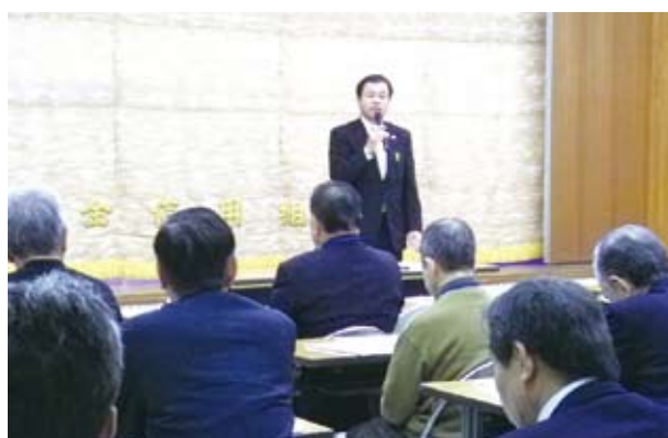
11/20 東金ブロック・石原東金税務署副署長の講話