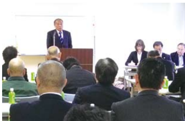
11/18 山武ブロック・小関ブロック長の挨拶