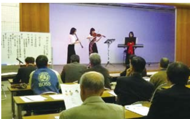
東金ブロック・クラリネットのタベ