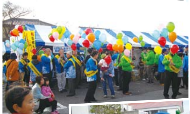
街頭キャンペーン (横芝光町 産業まつり)