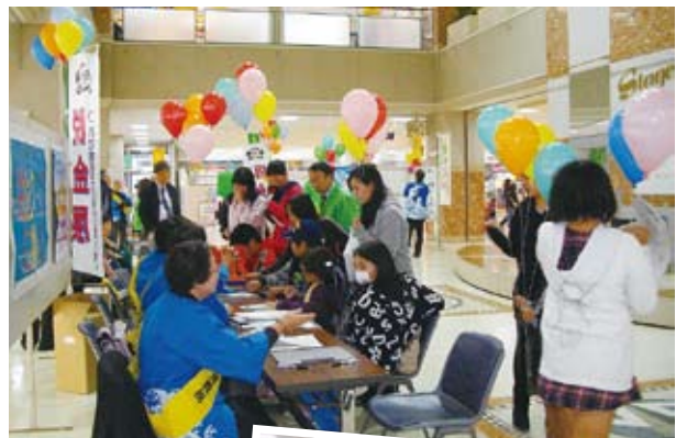
街頭キャンペーン (サンピア)