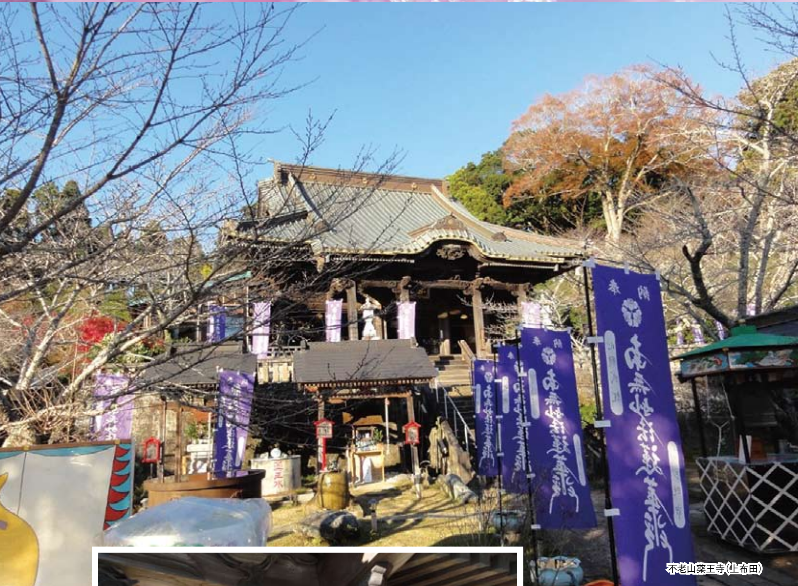
不老山薬王寺(止布田)