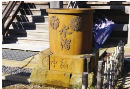
※参考資料：由来書「布田薬王寺」・東金市史

当山には山門から本堂に至る参道に皇室の菊の紋章が入った鉄製天水受4基がある。これは当山第25世日叙上人が嘉永2年（1849）京都妙満寺第219世となり上京、皇室の信頼も厚く大僧都に叙任され、2年の任期を終えて薬王寺に帰山する際、仁孝天皇の皇子、靈明院・常寂院の二方のご位牌を奉戴し、その御回向を母君から委託を受け、同時に御紋章御墨付を賜り、帰山後本堂に安置し、寺の宝物としたものであるが、その折江戸講中の奔走によって鉄製の天水受が寄贈されて、御紋章を鑄込むことになったのである。なお、第二次大戦の折軍部より供出の命が出たが、この由来書を提出して供出を免れ、今も寺の宝として残されている。