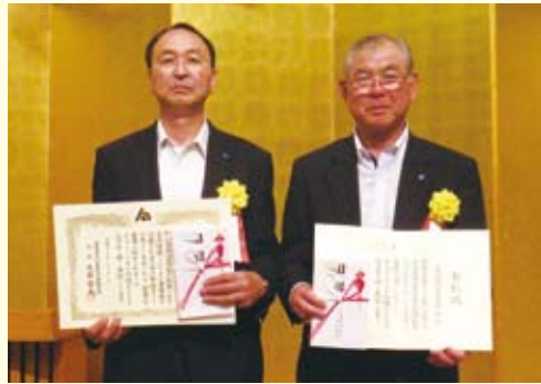
会員増強運動で受賞した矢部副会長(左)と福利厚生制度で受賞した真行寺副会長