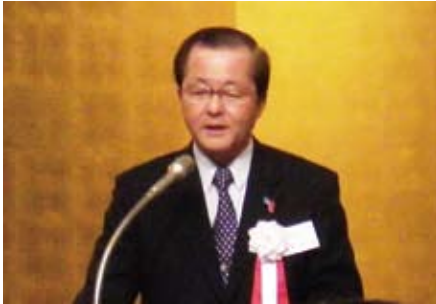
千葉県法人会連合会 大岩会長