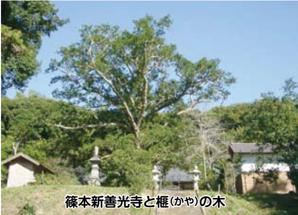
篠本新善光寺と榿(かや)の木

篠本新善光寺のある篠本は、横芝光町では最も北に位置するところにあつて、多古町や匝瑳市に隣接する。また、北西側には栗山川が流れ、その両岸は水田が広がる穀倉地帯でもある。篠本の集落は、そうした水田に囲まれた狭い下総台地に抱かれるように点在し、そのほぼ中心に新善光寺がある。このお寺の創建は定かではないが、承平五(935)年に勃発した平将門の乱の時、京の高僧寛朝がこれを鎮めるため、高雄山神護寺の不動明王を奉じて関東に下った際、九十九里尾垂ヶ浜 おだれがはま から成田へ行く途中、新善光寺に一旦とどまったといわれる。つまり平安時代中期にはすでに存在したことは確かで、また、近所の遺跡からは奈良時代の寺名墨書土器も出ていて、創建は古いとみられる。新善光寺は現在真言宗智山派であるが、寺の北西山上には日吉神社があつて、もとは天台宗であつたと思われる。新善光寺の名前の由来は、鎌倉時代に善光寺信仰が広まった折に、善光寺式阿弥陀三尊像が造られ、お寺に鎮座されたことによる。また、前の不動明王のこともあつて、お寺には不動明王の木造座像が本尊として鎮座し、このお寺には2体の本尊があるといつてもいいだろう。このようなことからこのお寺と成田山新勝寺とは