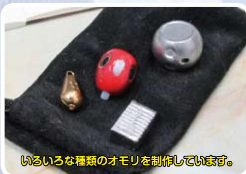
いろいろな種類のオモリを制作しています。

釣り用の定番オモリや投網用のチェーンは、機械が鉛を溶かしながら自動铸造するものが大半ですが、需要が少なくなったタイコ型や特殊な型のオモリは、手流し铸造機で作ります。