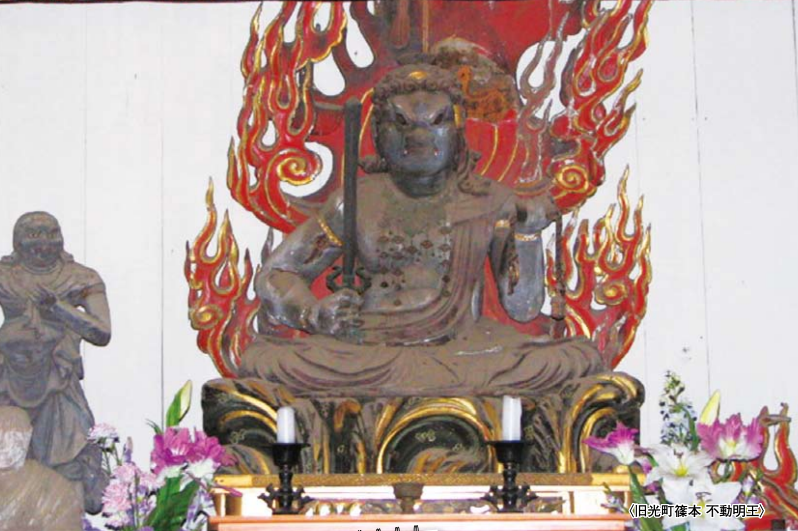
《旧光町篠本 不動明王》