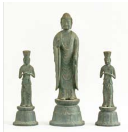
篠本新善光寺 銅造阿弥陀三尊像

新善光寺本堂の前には大きな榿 かや の木がそびえていて、境内を広く覆つていて、夏はいい木陰を作り出している。この榿の木は樹齢にして500年を超え、樹高は20m、幹回りは6mあり、かなりの古木である。以前の樹勢が強いところは秋多くの実を稔らせたが、近年は衰えてわずかに実を付けるのみである。