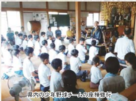
県内の少年野球チームの座禅修行

住職：昔の寺子屋はそういったものだったと思うのです。ただ文字を教えるのではなく、人となるべくしつけをしていた。住職となり地域のことを調べていくうちに、現在白里中学が建っているあたりからこの辺までの地に、江戸時代ははじめから明治まで檀林 だんりん といってお坊さんの学校があったことが分かったのです。これも、何かの縁だと感じそれまで胸にあったものを実施しようと思いました。