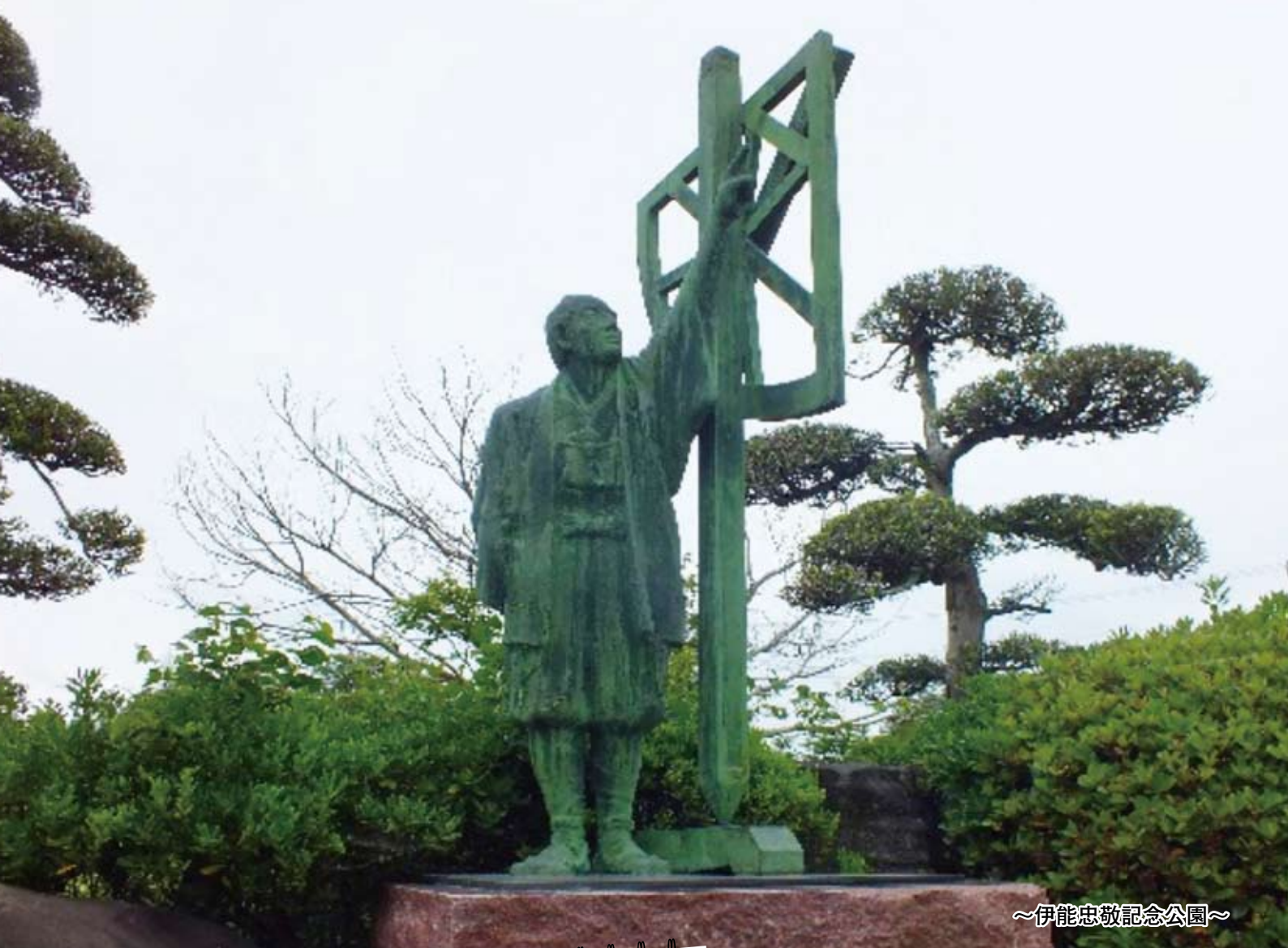
～伊能忠敬記念公園～