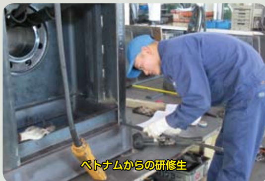
ベトナムからの研修生

大型の機械の向かい側に、TVや映画でも時折見かける旋盤の機械を職工さんが操作していました。この方は、ベトナムから来ている研修生とのこと。高橋マシニングでは、ベトナム研修生が5名勤務していて戦力となっていますが、研修制度では3年で帰国してしまうため、それが残念でならないとのこと。