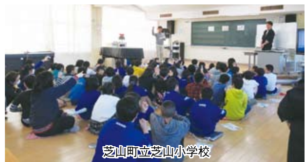
芝山町立芝山小学校