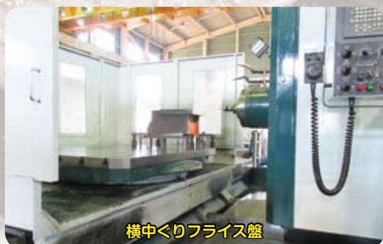
横中ぐりフライス盤

製品の完成から得られる達成感という快感より、ミクロン単位の精度を求められ続ける緊張感の方が重いということでしょうか。人材の確保は高度な物作りの現場の抱える難しい課題のようです。