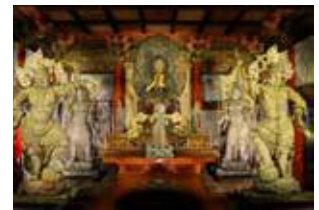
中央に御本尊のお釈迦さま 左右に四天王