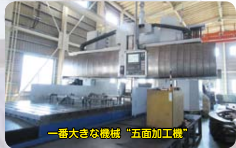
一番大きな機械“五面加工機”

目の前では工作機械の中で、厚く大きな板状の鋼材が治具にセットされ、溝を掘られている最中でした。手前にはすでに加工が終了した部材が下ろされ、新しい材料を治具にセットする作業が行われているところ。大きな材料を治具ごと機械にセットするのは大変そうに見えました。湾曲した部材は、繋いでいくと円形になり、それを横に連ねるとトンネルの構造体になるとのこと。単品・少量生産の受注が中心の中でも、このトンネル材は、短期間とはいえ加工数量は多い部類とのことでした。