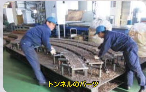
トンネルのパーツ