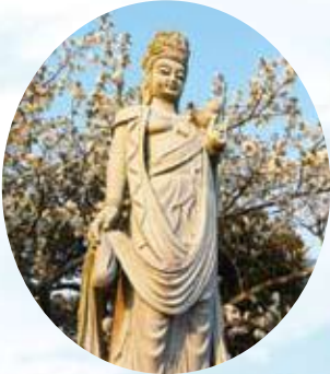
聖観音(しょうかんのん)さま