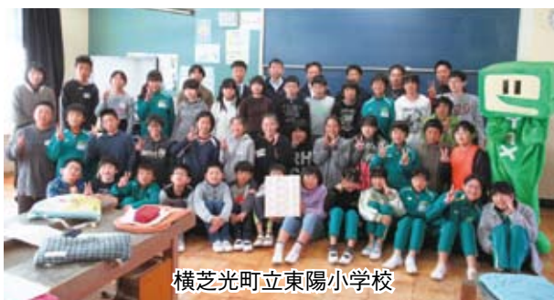
横芝光町立東陽小学校