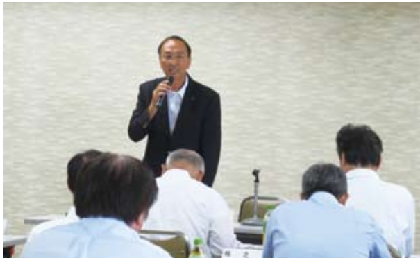
7月30日(月) 理事会・合同専門委員会