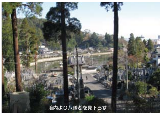
境内より八鶴湖を見下ろす

鳳凰山本漸寺は、東金市の谷（やつ）区にあって、顕本法華宗に属し、往昔は本山輪番上総十か寺（本漸寺、最福寺、妙徳寺、本松寺、法光寺＝以上東金市。本国寺、蓮照寺、正法寺＝以上大網白里市。善勝寺、本寿寺＝以上千葉市）の一つで、古刹最福寺と向かい合い、県立東金高等学校の並び八鶴湖を見下ろす城山の中腹にある名刹である。