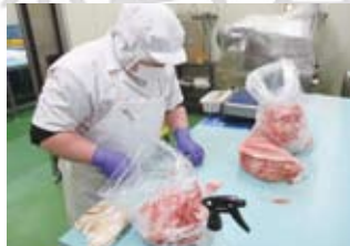
学校給食用の食肉加工

現在は、食肉に限らず、野菜も含めた食品の流通をまとめて管理する業務に加えて、飲食に特化した店舗経営の総合支援サービスや学校給食の製造を行っています。ラーメン店等、出店の企画から店舗の確保、内装、厨房設備、決済方法に至るまで飲食店の経営のすべてをパッケージングして支援することも業務にしています。クライアントは個人より多店舗展開を検討している法人が対象ですね。