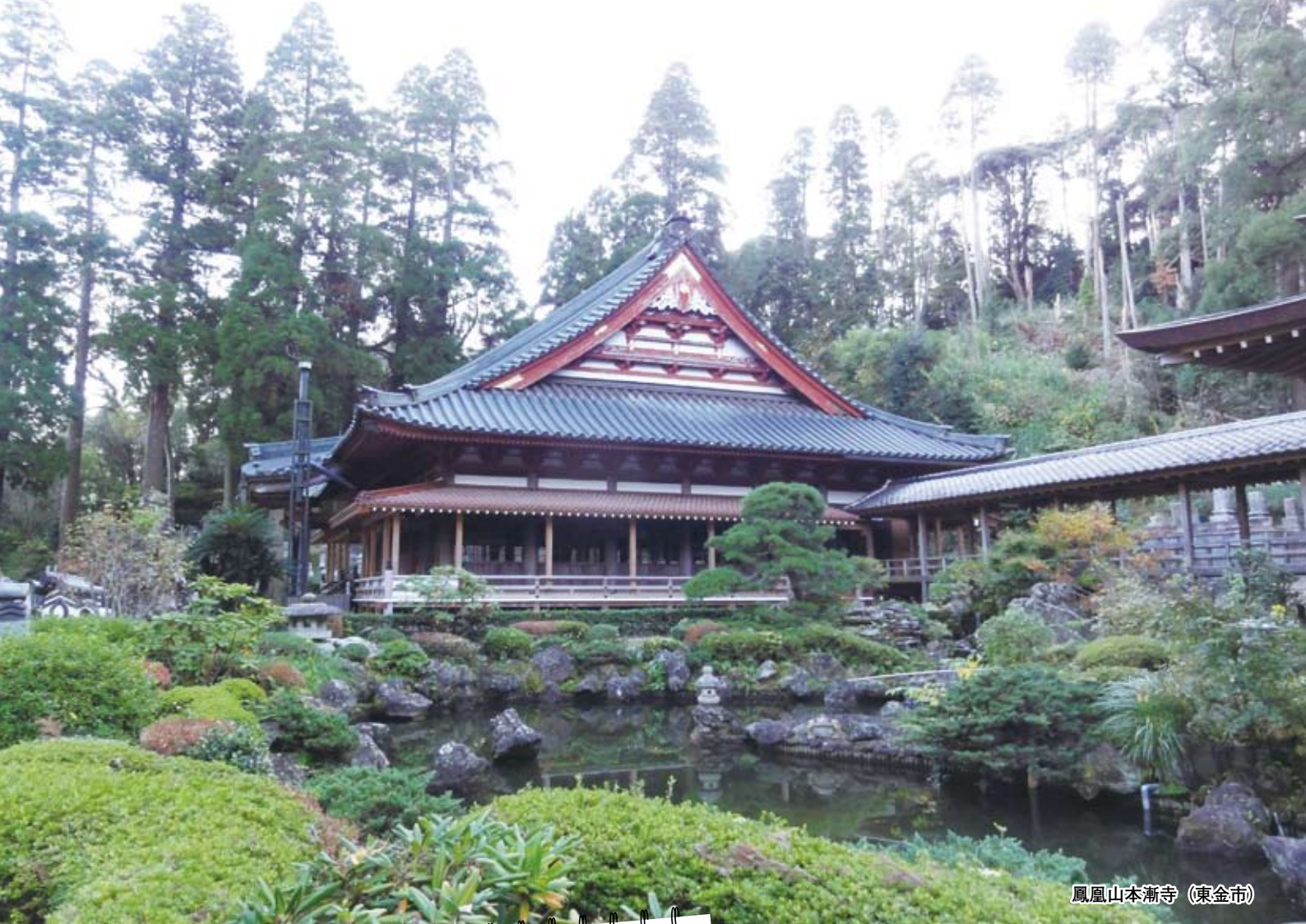
鳳凰山本漸寺 (東金市)