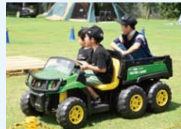
夏には夏祭りを開催し、キャンプ体験や電動トラクター体験を提供しています！青空の下、全面芝生のグラウンドの上でBBQやゲームと大盛り上がりです！