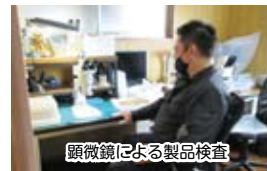
顕微鏡による製品検査

市東社長: 息子が 2 人一緒に働いてくれています。問題は技術の伝達です。時間がかかるんですよ。自分の時でも 10~20 年かかりましたが、あのころと違って益々技術レベルが上がってきているんでね。難しいです。私は父の死がきっかけで引継ぎましたが、どういう形で承継するか考えているところです。