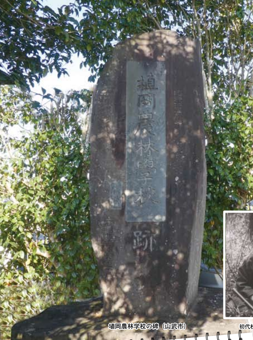
埴岡農林学校の碑 (山武市)