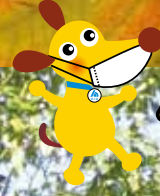
法人会キャラクター ケンタンくん