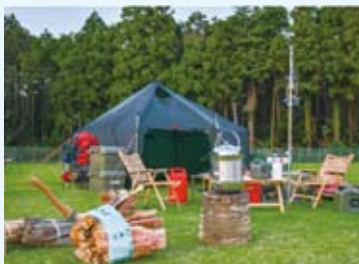
ゆめパーク牧野でのキャンプの様子です！ ゆめパーク牧野では広大な天然芝 100%のグラウンドでキャンプやBBQが楽しめます♪

なお、ゆめパーク牧野を運営している『(一社)みどりと空のプロジェクト』は当会の会員であり、芝山町の発展と活性化に寄与することを理念におき、廃校跡地の有効利用や体験観光の企画、田舎暮らし体験ツアーやキャンプ大会など、多岐にわたる活動をされています。もしもの時にはAEDを活用していただければと思います。