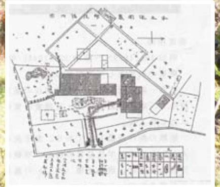
埴岡農林学校構内図