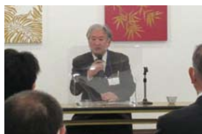
東金税務署 金井副署長 講話