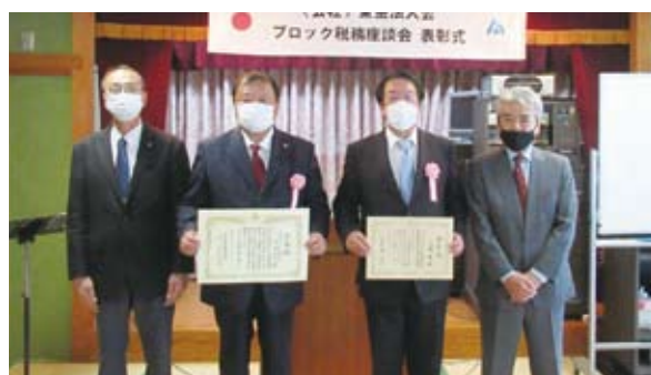
九十九里ブロック表彰式