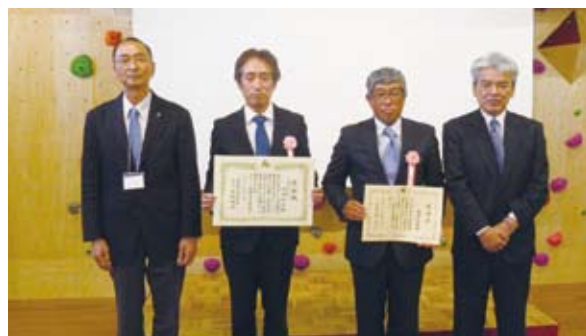
横芝光・芝山ブロック表彰式