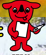
千葉県PR マスコットキャラクター チーバンくん