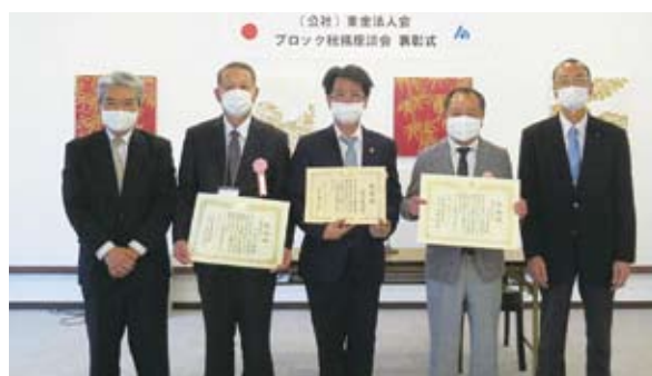
山武ブロック表彰式