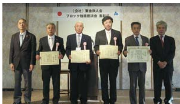
東金ブロック表彰式