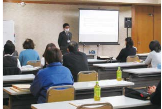
有嶋調査官による説明