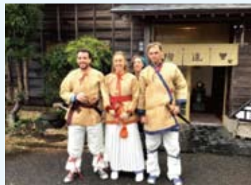
みどりと空のプロジェクトでは芝山町の魅力を発信すべく、インバウンドを対象とした体験型ツアーを企画、実施していきます。